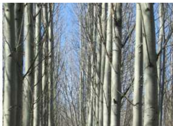
2. Ogledni zasad klonskih belih topola