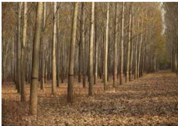
1. Plantaža klonskih crnih topola

Gajenje mekih lišćara u intenzivnim zasadima obezbeđuje proizvodnju drveta visokog kvaliteta u relativno kratkim ophodnjama i visokim prinosima po jedinici površine zasada. Podrazumeva primenu intenzivnih tehnologija i visokoprinosa selekcionisanih sorti (klonova). Stvaranje selekcionisanih sorti predstavlja složen i dugoročni proces i multidisciplinarni naučno-istraživački pristup. Realizacija Programa stvaranja i uvođenja u proizvodnju novih sorti odvija se kroz niz specijalističkih postupaka i procedura, kao što su: Genetička proučavanja varijabilnosti i naslednosti najvažnijih svojstava istraživanih vrsta (brzina rasta, osetljivost prema bolestima i štetočinama, sposobnost vegetativnog razmnožavanja, mehanička i tehnička svojstva i drugo); Hibridizacija u cilju stvaranja novih genotipova sa povoljnom kombinacijom poželjnih svojstava; Osnivanje i očuvanje genofonda vrsta i hibrida topola i vrba; Testiranje hibridnih potomstava i potencijalnih novih sorti; Registracija i uvođenje u proizvodnju novih sorti.