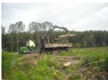
1. Utovar sortimenata

3. Istraživanja efekata rada traktorske ekipaže i ustanovljavanje normi i normativa rada na poslovima iskorišćavanja šuma sa posebnim osvrtom na osposobljavanje kadra za poslove normiranja. Izbor tehnike i tehnologije rada u šumarstvu je značajan sa tehnološkog, ekonomskog, ekološkog, ergometrijskog, i energetskog gledišta. U savremenom šumarstvu problem izbora sredstava za rad svodi se na izbor između dva ili više različitih sredstava. Njihova primena zasniva se na iznalaženju najpovoljnijeg rešenja koje nastaje kao rezultat višekriterijumske optimizacije. U okviru realizacije projekta izvršena je obuka stručnjaka preduzeća za izvršenje snimanja normi i normativa radova na korišćenju šuma, što je kasnije prošireno i na poslove gajenja šuma, a pod nadzorom eksperata šumarskog fakulteta. Kao konačni rezultat se očekuje izrada normi i normativa radova za sva sredstva i vrste radova u preduzeću.