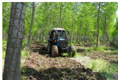
2. Tanjiranje plantaže topola

Sa Institutom za pesticide i zaštitu životne sredine iz Zemuna realizuju se na osnovu Ugovora o poslovno-tehničkoj saradnji sledeća istraživanja: