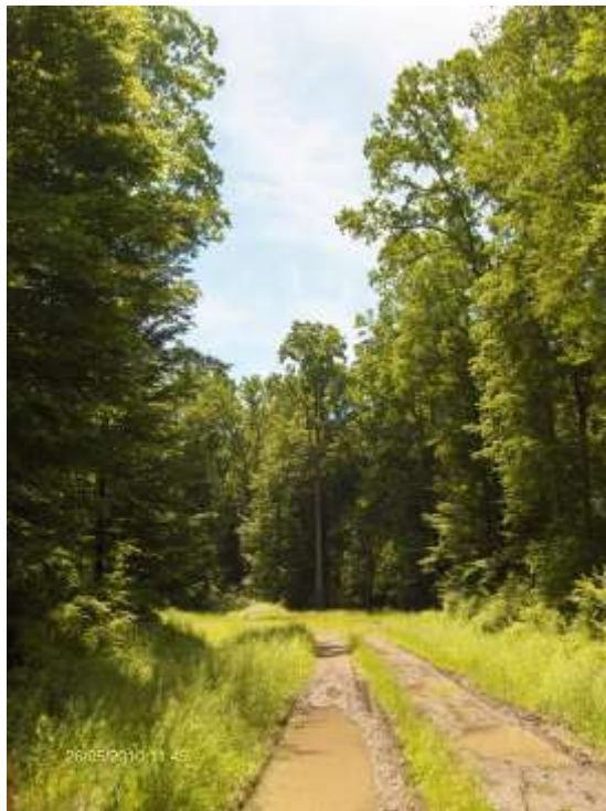
1. Šuma hrasta lužnjaka u Sremu