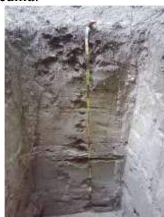
2. Humofluvisol, forma:peskovita