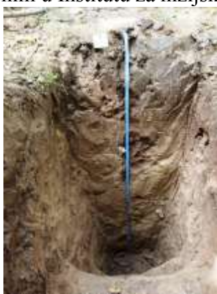
1. Humofluvisol (livadska crnica na lesoaluvijumu)

3. Proučavanje staništa topola i vrba i izrada pedoloških karata. Staništa topola i vrba se nalaze u inundacijama naših velikih reka i pripadaju kompleksu aluvijalno-higrofilnih šuma. Ova zona predstavlja jedan od najdinamičnijih ekosistema, kako sa gledišta razmeštaja i dinamike biljnih zajednica, tako i sa gledišta obrazovanja zemljišta i dinamike hidrološkog režima i stepena antropogenog uticaja. U takvim bioekološkim uslovima odvija se i proizvodnja drveta topola i vrba. Navedeni proces se odvija na relaciji sorta-stanište-tehnologija. Prema tome, poznavanje svojstava staništa predstavlja jedan od osnovnih faktora tehnološkog procesa gajenja topola i vrba u intenzivnim zasadima. U dosadašnjim istraživanjima se pokazalo da je zemljište jedan od najvažnih faktora. Proučavanje i kartiranje zemljišta počiva na proverenim metodama i iskustvima stečenim u Institutu za nizijsko šumarstvo i životnu sredinu.