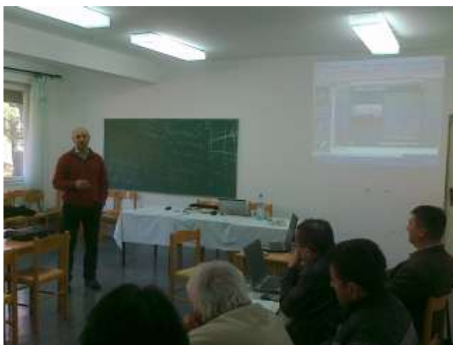
1. Usavršavanje stručnjaka

Pored realizacije navedenih razvojnih programa i projekata, saradnja sa navedenim naučnim i obrazovnim institucijama se odvija i u oblasti obrazovanja u vidu usavršavanje stručnjaka u određenim specijalističkim naučnim i stručnim oblastima, kao i obuke tehničkog i drugog osoblja za obavljanje određenih složenijih poslova i radnih operacija.