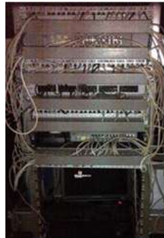
2. Orman komunikacionog čvorišta