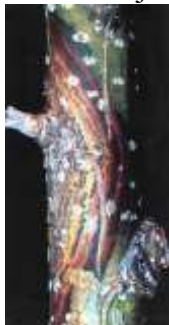
1. Dotchiza populea

2. Zaštita šuma, semenskih objekata i rasadnika od bolesti, štetočina i korova. Javno preduzeće „Vojvodinašume“ u okviru svojih delatnosti ima značajne obaveze u oblasti zaštite šuma koje proističu iz Zakona o zdravlju bilja, Zakona o šumama i obaveza koje proističu iz šumskih osnova. U cilju što kvalitetnijeg obavljanja poslova u skladu sa navedenim obavezama uz podršku eksperata za zaštitu šuma Instituta, realizuju se sledeći programi u ovoj oblasti: A) Zaštita od štetnih faktora u rasadnicima, zasadima, kulturama, plantažama, semenskim objektima i rasadnicima; B) Saradnja na radovima prognozno-izveštajne službe (PIS) zaštite šuma na području JP „Vojvodinašume“ i C) Suzbijanje korovske vegetacije u rasadnicima i zasadima topola i obnovljenim šumama hrasta lužnjaka.