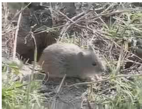
2. Poljska voluharica