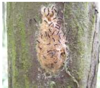
2. Leglo gubara

3. Proučavanje staništa topola i vrba i izrada pedoloških karata. Staništa topola i vrba se nalaze u inundacijama naših velikih reka i pripadaju kompleksu aluvijalno-higrofilnih šuma. Ova zona predstavlja jedan od najdinamičnijih ekosistema, kako sa gledišta razmeštaja i dinamike biljnih zajednica, tako i sa gledišta obrazovanja zemljišta i dinamike hidrološkog režima i stepena antropogenog uticaja. U takvim bioekološkim uslovima odvija se i proizvodnja drveta topola i vrba. Navedeni proces se odvija na relaciji sorta-stanište-tehnologija. Prema tome, poznavanje svojstava staništa predstavlja jedan od osnovnih faktora tehnološkog procesa gajenja topola i vrba u intenzivnim zasadima. U dosadašnjim istraživanjima se pokazalo da je zemljište jedan od najvažnih faktora. Proučavanje i kartiranje zemljišta počiva na proverenim metodama i iskustvima stečenim u Institutu za nizijsko šumarstvo i životnu sredinu.