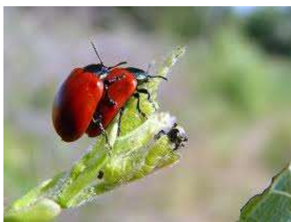
2. Melasoma populi