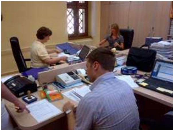
1. Informaciona tehnologija u svakodnevnoj primeni

Služba Informatike planira obuku zaposlenih za unapređenju znanja u korišćenju osnovnih računarskih aplikacija, specijalizovanog ERP softvera i namenskih softvera za šumarstvo.