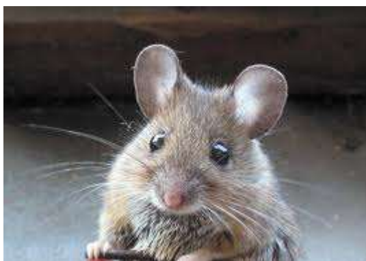
1. Mali šumski miš miš

izboru sredstava zaštite, nametnulo je potrebu proučavanja i praćenja populacija ovih štetočina, njihovu pouzdanu determinaciji i iznalaženje mogućnosti efikasnih i ekološki prihvatljivih metoda kontrole brojnosti njihovih populacija.