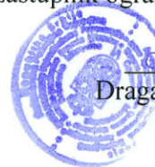
Dragan Vulin dipl. inž. šum.